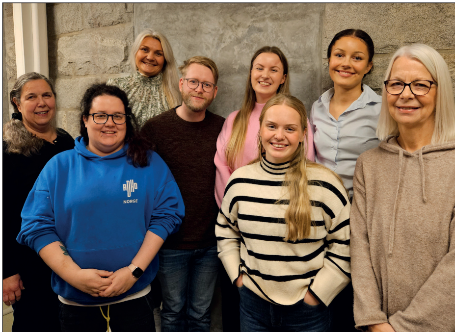
Kurs for brukermedvirkere 5. november.

I løpet av 2024 har Brukerutvalget og administrasjonen lagt vekt på bedre oppfølging av brukerrepresentanter på Nordlandssykehuset. 5. november ble det gjennomført kurs for brukermedvirkere ved Nordlandssykehuset. Dette er det fjerde kurset som gjennomføres.