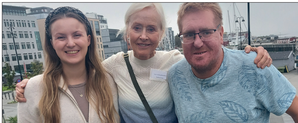
Representanter fra Brukerutvalget på Regional Brukerkonferanse 2024.