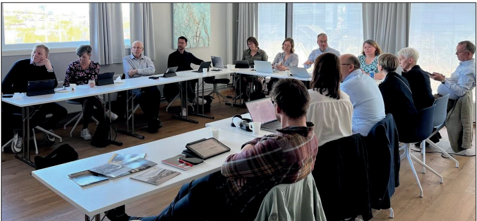
Styremøte i Nordlandssykehuset 22. mai i Vesterålen. Brukerutvalgets leder har fast plass i styret.