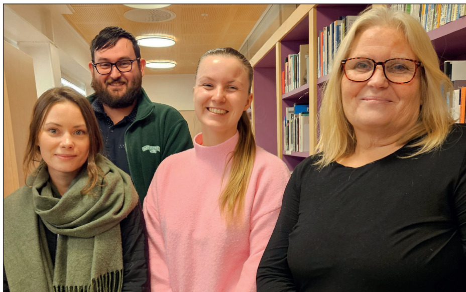
Deler av Brukerutvalget på møte på lærings- og mestringssenteret i Bodø.