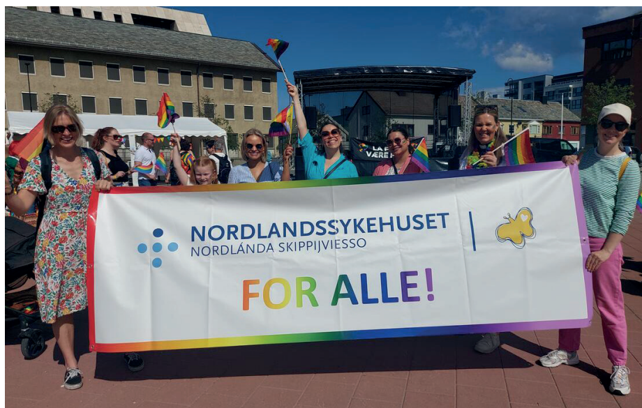
Nordlandssykehuset representert Pride-paraden.

Ungdomsrådet driver sin aktivitet innenfor gitt budsjett.