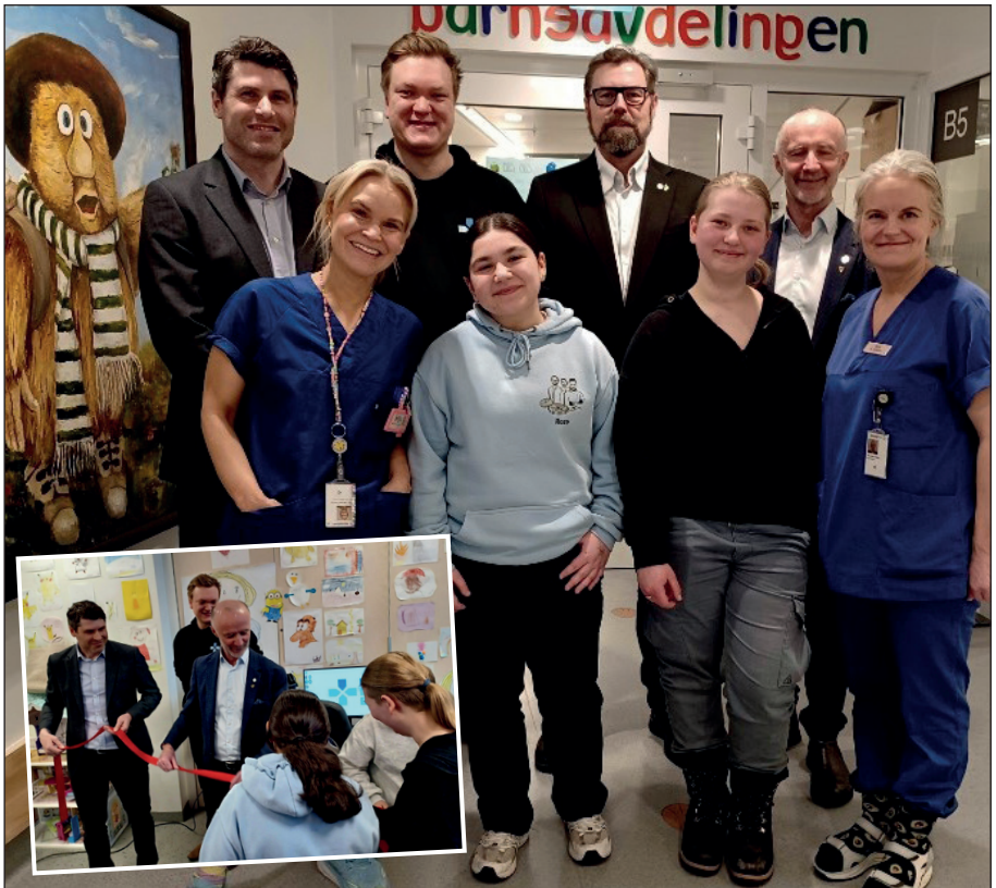
Overrekkelse av gaming utstyr til gaming rom på barneavdelingen den 26.mars.