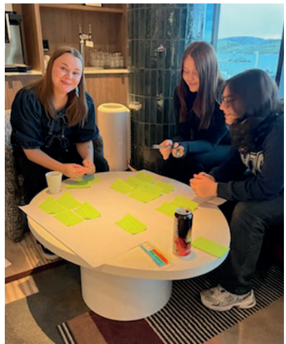
Gruppearbeid under helgesamlingen»